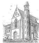
Parochie O.L.V. Onbevlekt Ontvangen Zenderen

Willen wij onze parochiegemeenschap in stand houden is het van groot belang dat wij binnen onze gemeenschap iemand vinden die de handschoen oppakt en samen met ons de "kar" gaat trekken.